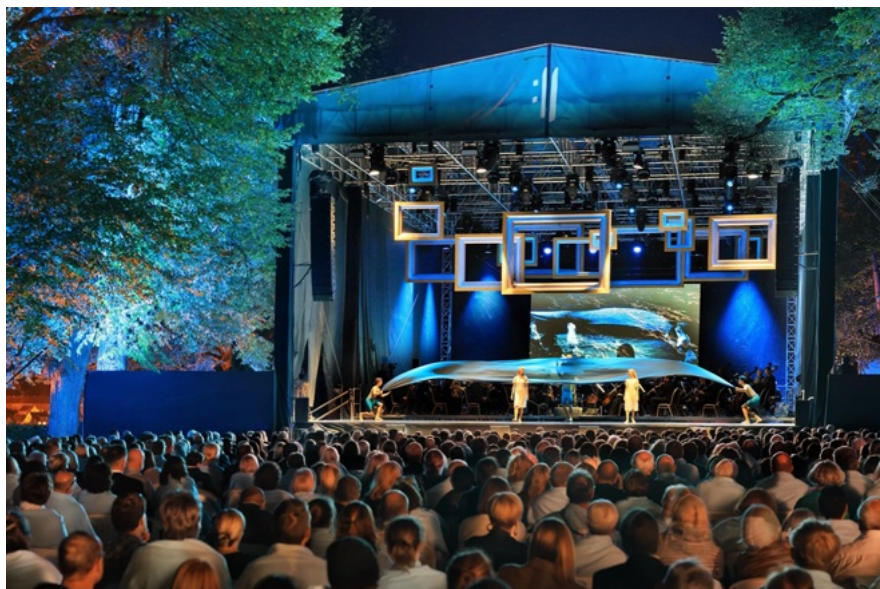
Festival Krumlov